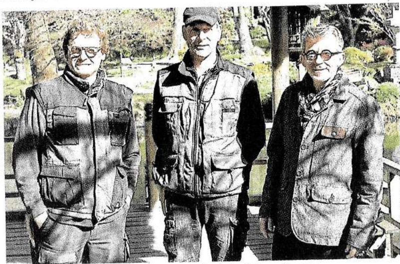
Jamy Gourmaud (à droite), en compagnie de jardiniers du parc.

L'émission Comme une envie de jardin a été tournée à Maulévrier au printemps dernier, dans le Parc oriental et au potager du château Colbert. Elle est diffusée ce dimanche